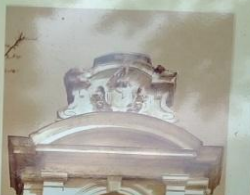
САДИБА РЕЯ (XVIII-XIX СТ.) Пам'ятник архітектури національного значення