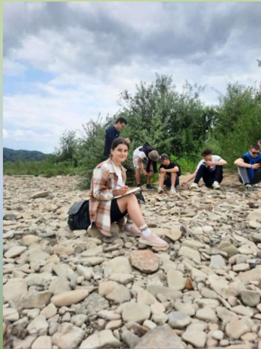
Низька і висока (заросла верболозами) заплави р. Стрий