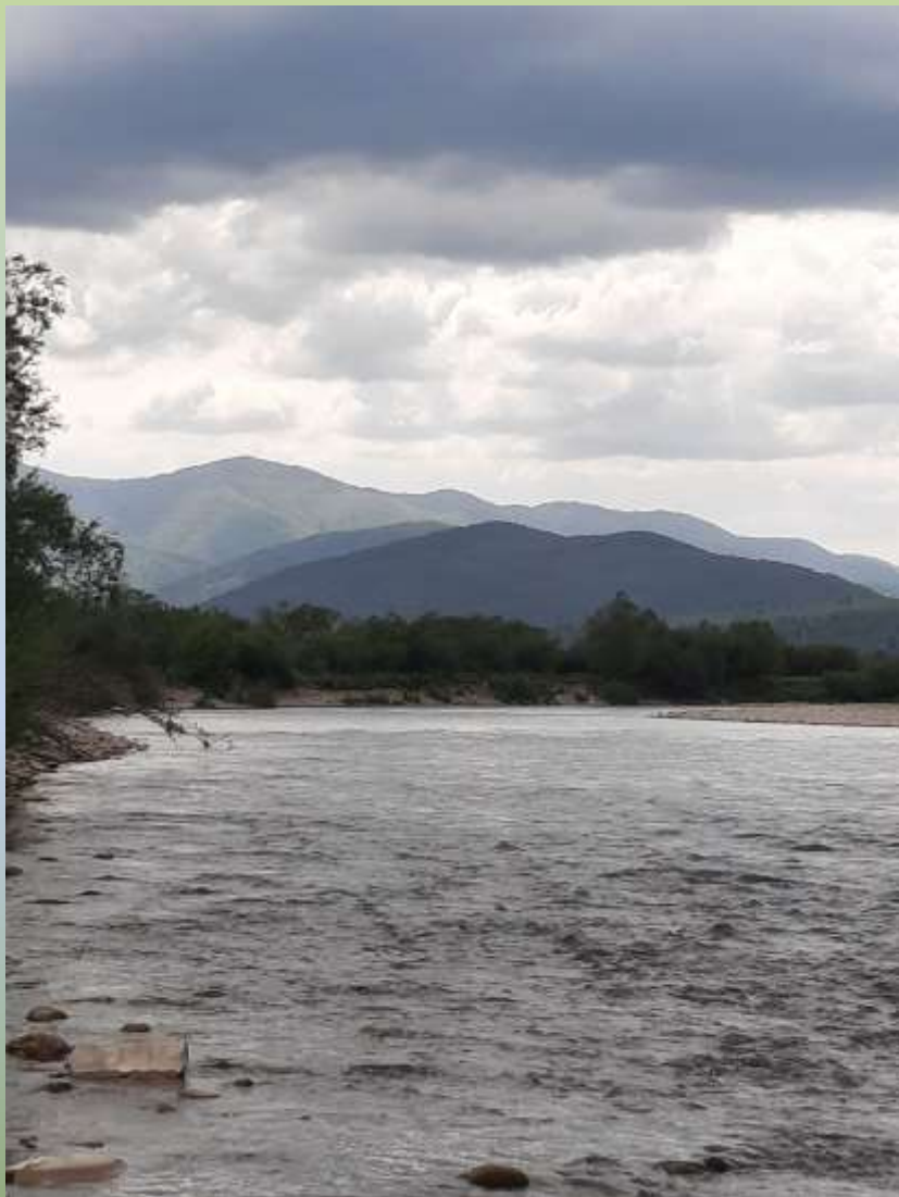
Русло р. Стрий біля с. Верхнє Синьовидне