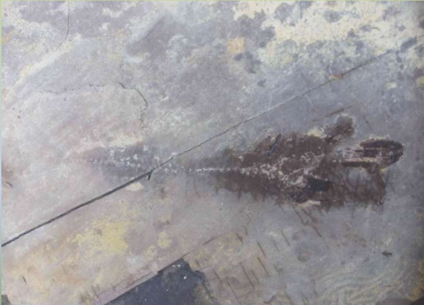
Знахідка відбитку олігоценової риби в аргіліті під час вивчення відкладів менітової світи в межах хутора Побук (правобережжя р. Опір)