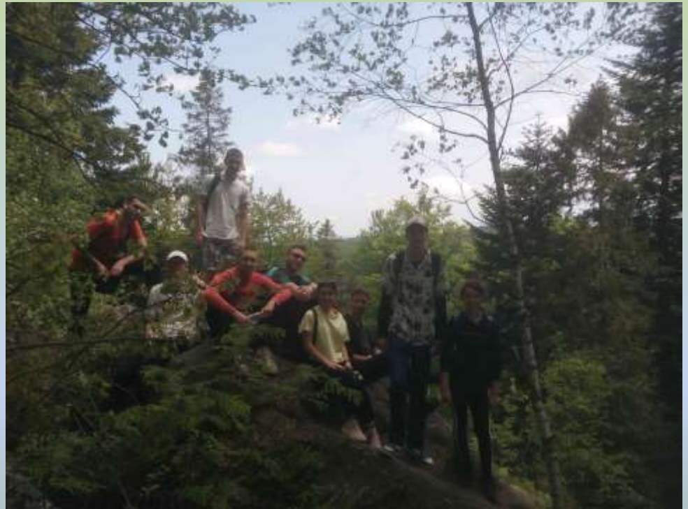
Відклади стрийської світи в гребеневій частині хребта і гори Ключ