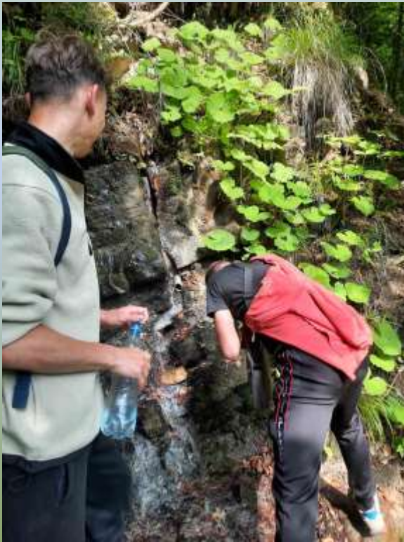
Джерело мінеральної води у відкладах стрийської світи в долині р. Кам'янка