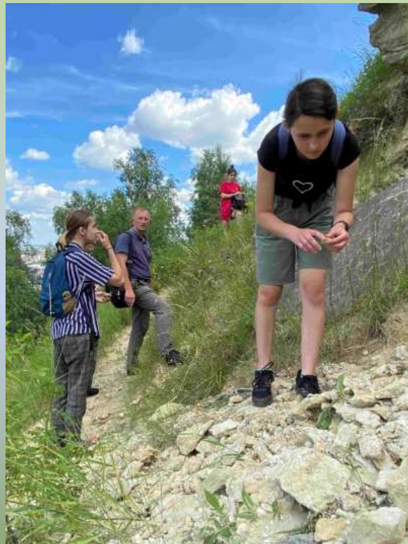
На відслоненні верхньобаденських відкладів. Гора Піщана (м. Львів)