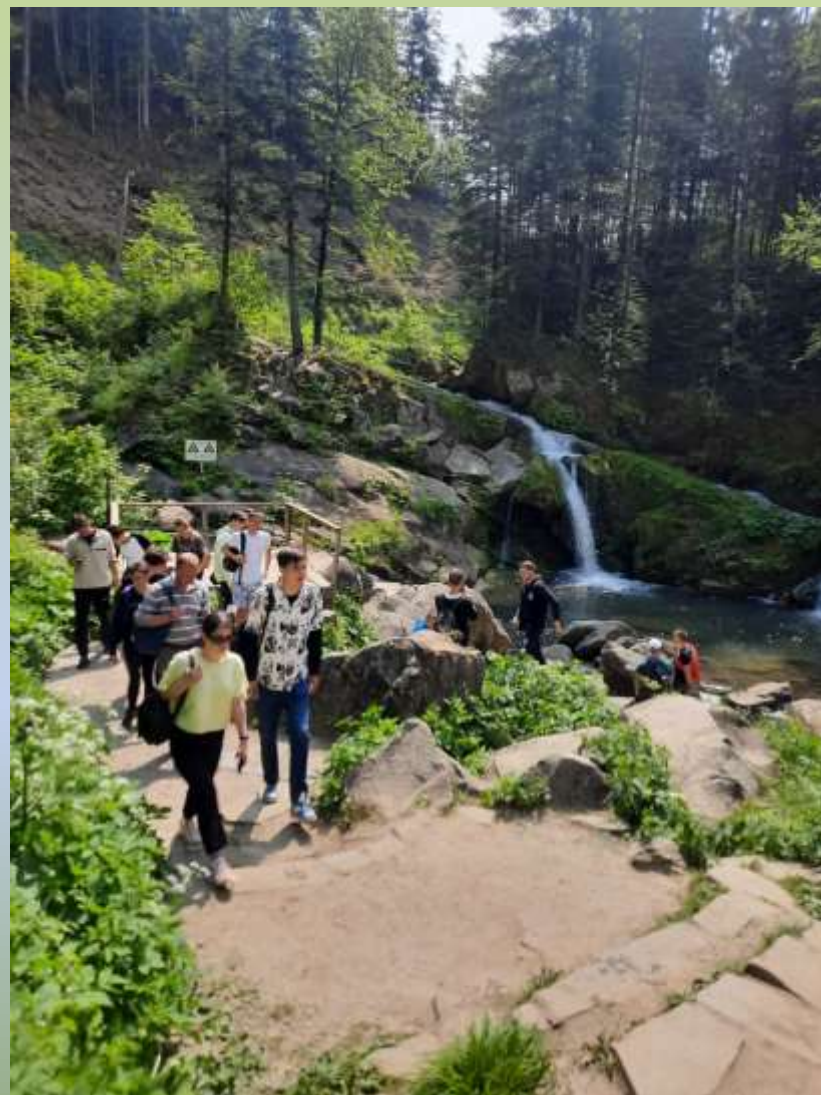
Відслонення товстошаруватих і масивних пісковиків ямненської світи в уступах водоспаду у руслі р. Кам'янка та схилах її долини