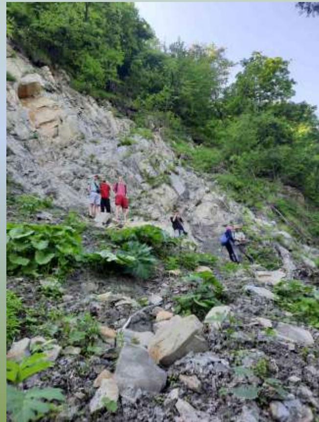
Відклади стрийської світи в зоні насуву Орівської скиби на правобережжі р. Стрий