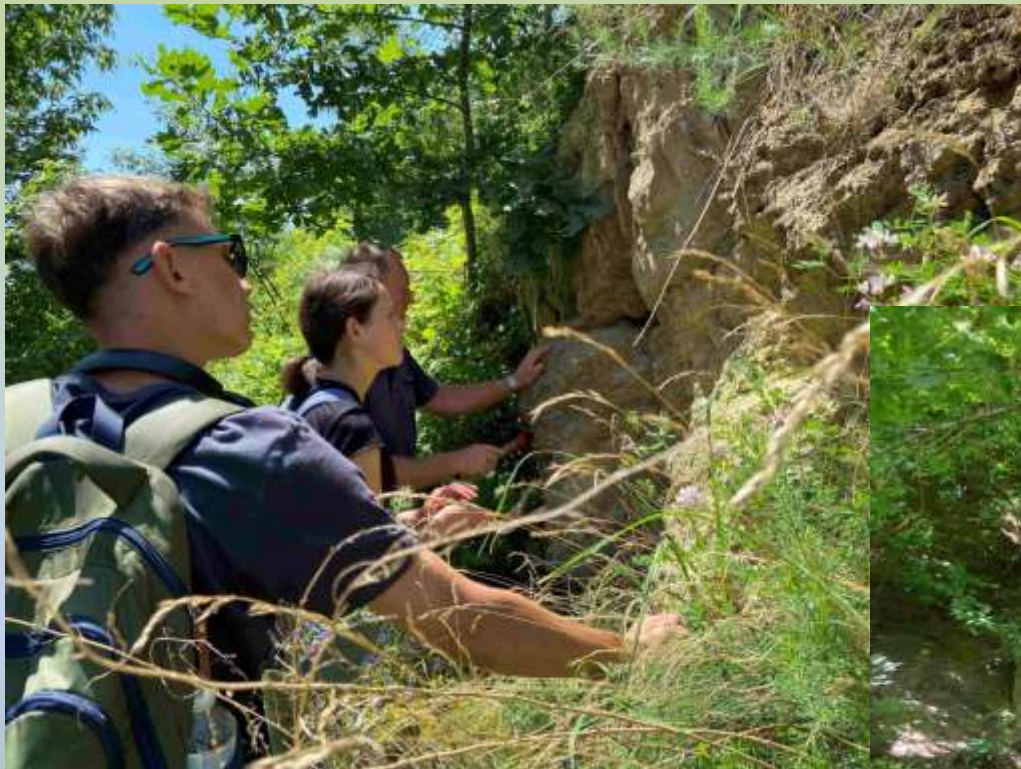
Біля відслонення фації піщаного бару верхньобаденського моря