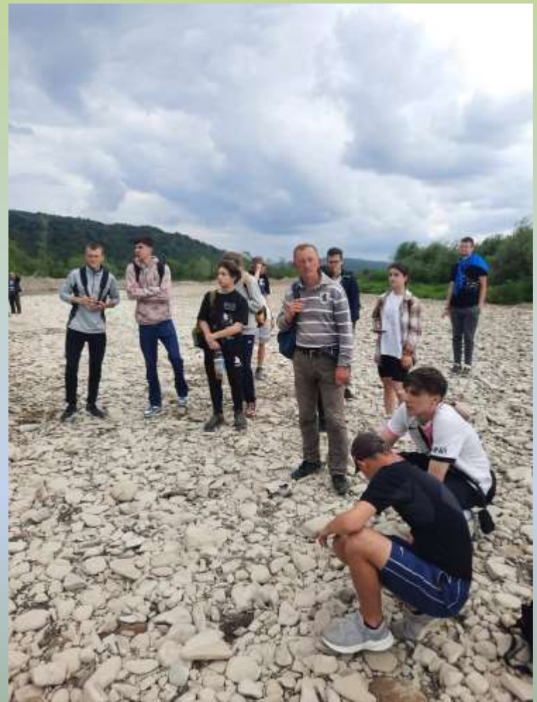
Сучасний алювій р. Стрий