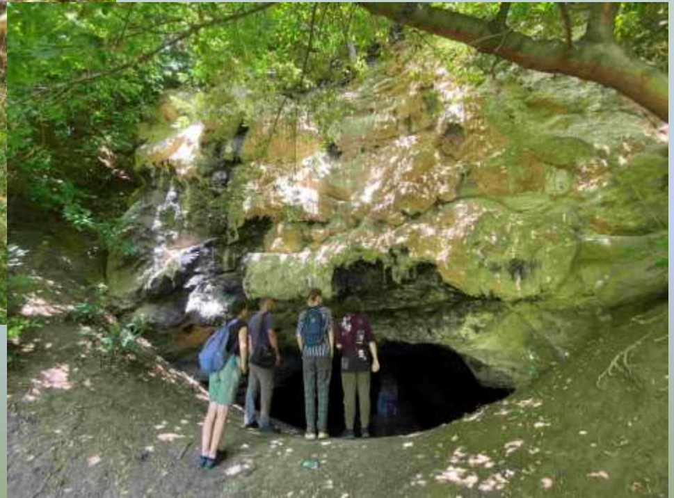
На відслоненні фації хемогенних вапняків (ратинські верстви).